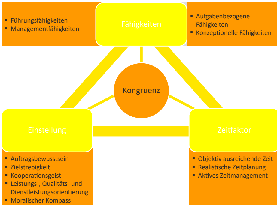
Abbildung 4.2: Erfolgsfaktoren der Auftragserfüllung

Die richtige Einstellung besteht insbesondere aus einem klaren Auftragsbewusstsein, Zielstrebigkeit, einem guten Kooperationsgeist sowie hoher Leistungs-, Qualitäts- und Dienstleistungsorientierung. Als verknüpfendes Element ist dabei ein gesunder moralischer Kompass – also die Fähigkeit, jederzeit richtig und falsch unterscheiden zu können – besonders wichtig. Diese Aspekte werden auch als das Heptagon leistungs-fördernder Einstellungen bezeichnet.